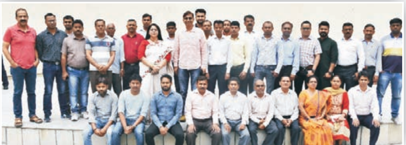
गैर-शिक्षण एवं प्रशासनिक स्टॉफ