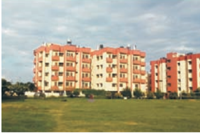
खेल का मैदान

उपरोक्त के अलावा, कॉलेज में ऑडिटोरियम, एम्फीथिएटर, लेक्चर थिएटर, कॉन्फ्रेंस रूम, हरे-भरे खेल के मैदान और शिक्षकों के लिए सुसज्जित स्टाफ रूम हैं।